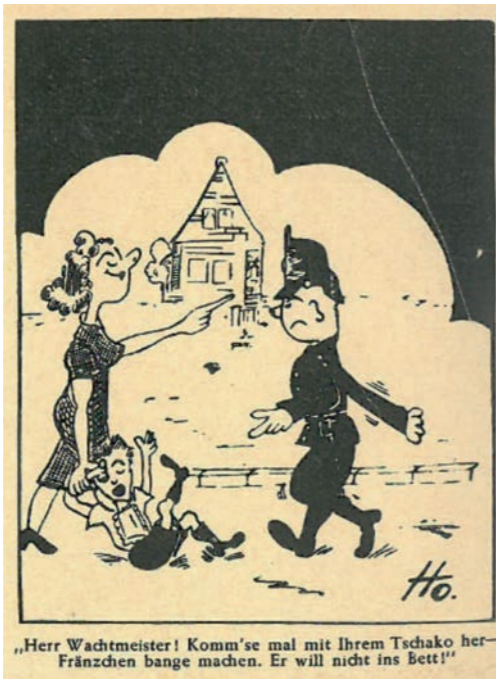
Karikatur von 1954.

An erster Stelle stand laut den Berichten die „Erziehungsarbeit“ an allen Mitgliedern des Bundes, aber auch die „Aufklärung und Werbung bei der Bevölkerung nach außen“: „Wir müssen alle daran arbeiten, eine Polizeibeamtenschaft zu erziehen, die durch Sauberkeit, Selbstzucht und ein ausgeprägtes Rechtsempfinden das Vertrauen der Bevölkerung erringt und an Stelle der polizeilichen Machtausübung die Kunst des Dienens stellt“ (Geschäftsbericht zum 1. Bundestag am 16./17. März 1950).