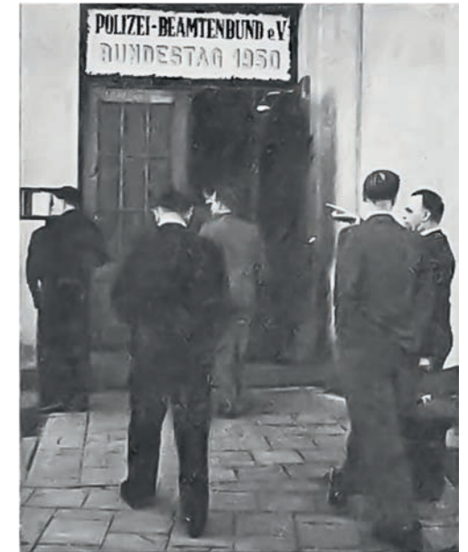
Der erste Bundestag fand in Hannover statt.

genen Weiterbildung und Beiträgen für den Polzeisportverein und den Bund monatlich insgesamt 267,50 DM aufwenden. Die Schlussfolgerung: „Wie der verheiratete Polizeibeamte bei einem Einkommen von 220,- DM unter Berücksichtigung der vorstehenden Kosten sich Erholung und Entspannung von seinem anstrengenden Dienst durch den Besuch von Film, Theater, Konzerten und ähnlichen kulturellen Veranstaltungen ermöglichen will, erscheint uns einfach utopisch. Die große Masse der Beamtenschaft ist weit von ihrem notwendigen Existenzminimum entfernt.“ 1953 konnte mitgeteilt werden, dass die Besoldung um 40 Prozent gegenüber 1927 erhöht worden war, die GdP die Zahlung einer Zehrzulage erreicht hat und auch Pauschvergütungen erhöht worden waren.