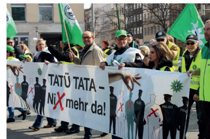
Übertragung der Abschlüsse auf die Beamtenschaft gedrängt wird.

Die Tarifverhandlungen TV-L begleitet die GdP regelmäßig über ihre Tarifkommission. Flankierend werden Demonstrationen organisiert, bei denen u.a. auch auf die zeit- und inhaltsgleiche