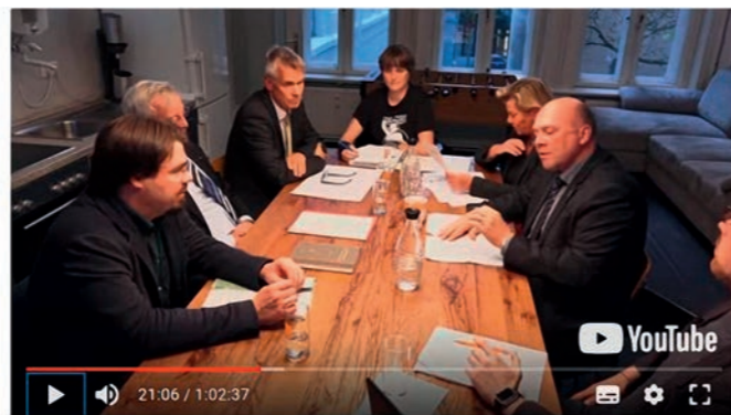
Ausgestrahlt am 09.10.18 um 19:00

über das neue Niedersächsische Polizei- und Ordnungsbehörden-gesetzes (NPOG). Die GdP hat mehrfach Stellung bezogen und war gefragter Interviewpartner.